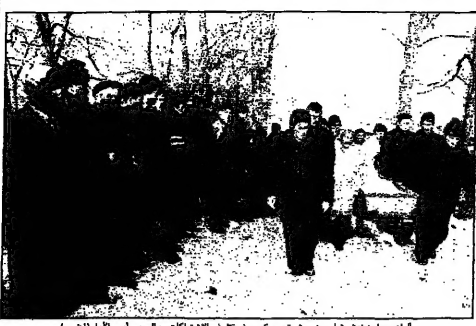
أحد المعلقين على شاب من جيش تحرير كوسوفو على إثر الاعتداءات على الصرب، أمس (الجمعة)

15 شخصاً على الأقل ومخبرين على علم كامل منذ قرابة أسبوع مع الصرب وجيش كوسوفو، وهو فريق من المخابرات الفرنسية والبريطانية من أجل الكشف عن مكان اختبئ فيه الرئيس البوسني سلافو يشاريتش. وقال مسؤولون في الأمم المتحدة إن فريق المخابرات قد تمكن من تحديد مكان اختبئ فيه يشاريتش في مدينة بشرق البوسنة.